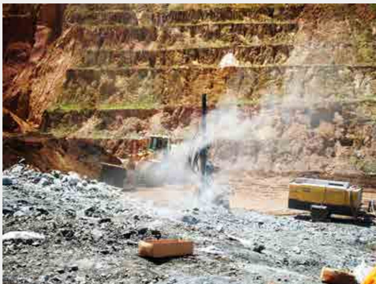
Foto de situação de grave e iminente risco com atividades de perfuração concomitantes com carregamento de explosivos.