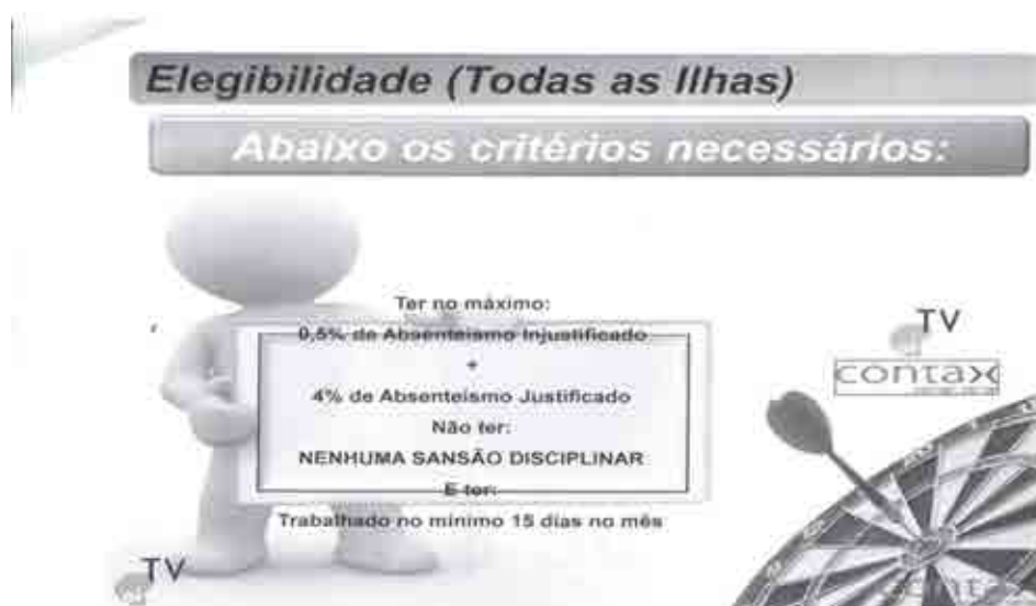
Figura 1 - Critérios para o recebimento da Remuneração Variável-RV- Empresa X