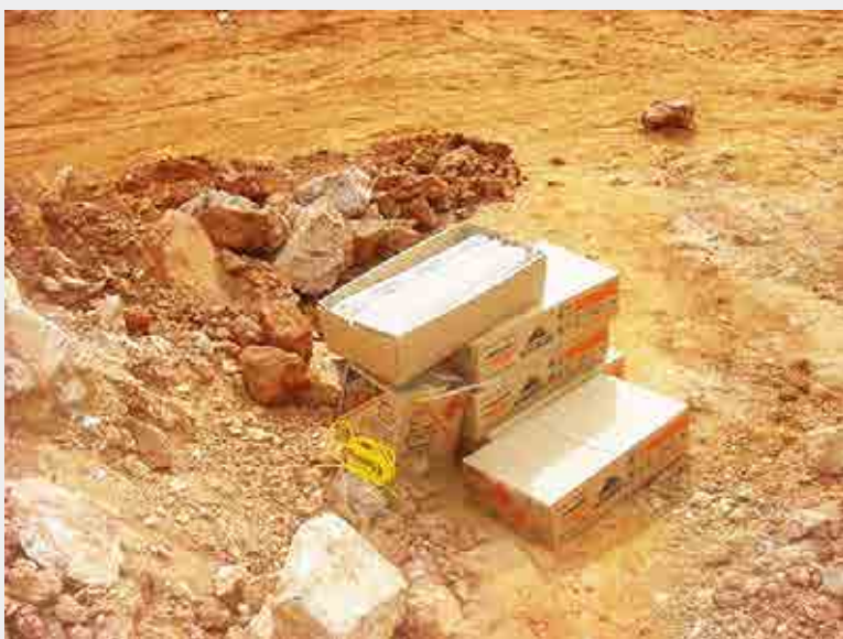
Foto de explosivos não utilizados deixados em local próximo ao trânsito de equipamentos