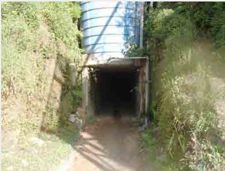
Saída de emergência de mina subterrânea

A ausência de vias de saída de emergência é uma situação de grave e iminente risco que implica na paralisação das atividades da mina.