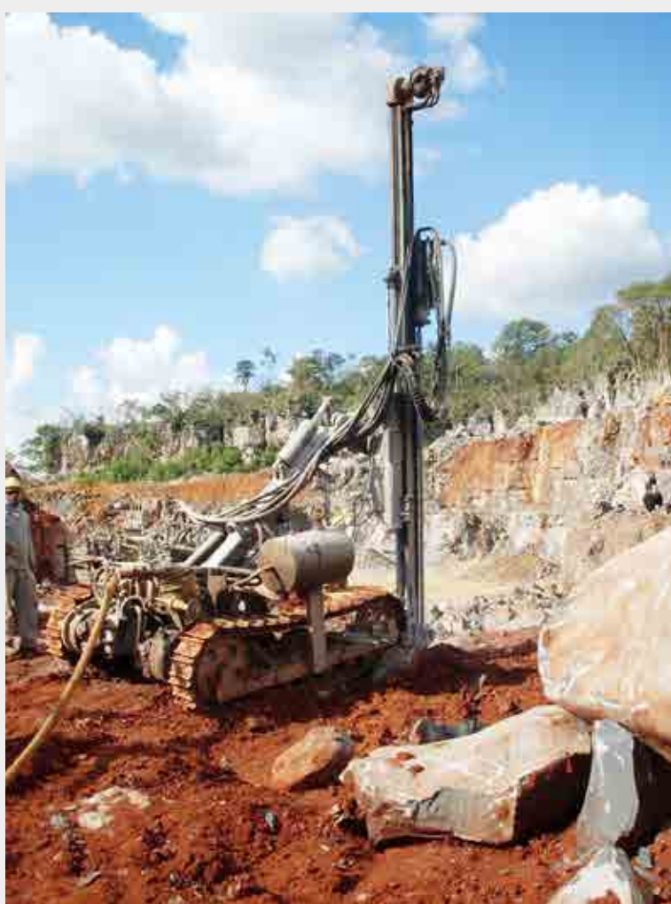
Perfuratriz dotada de sistema de umidificação