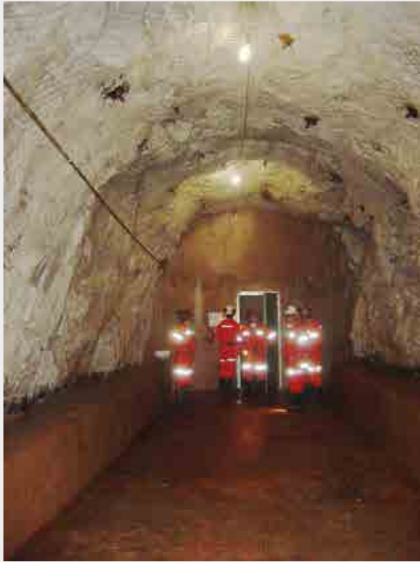
Entrada de depósito de explosivo em subsolo