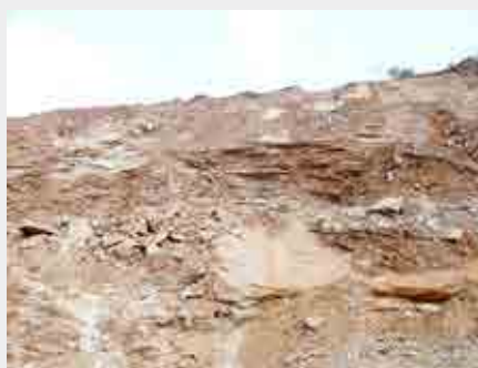
Maciços desarticulados com taludes negativos