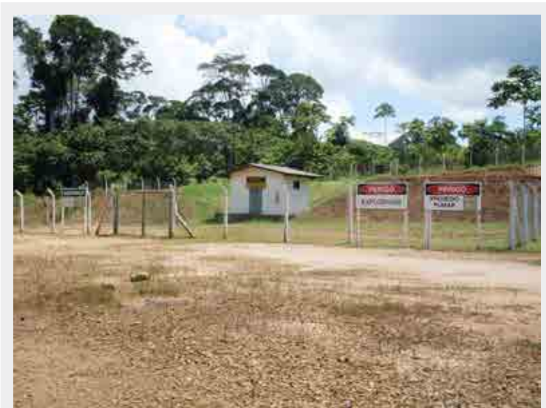
Depósito de explosivos de mineração a céu aberto