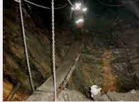
Fotos de aberturas com risco de queda de pessoas