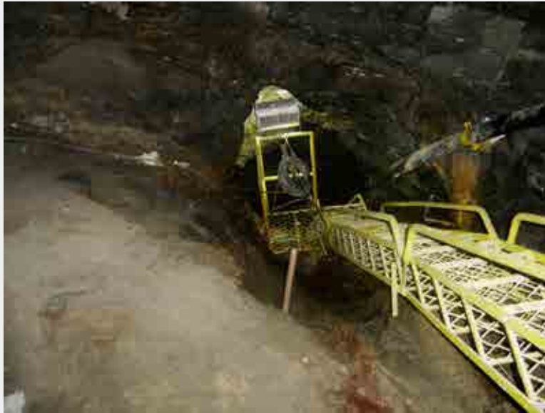
Escada de saída para saída de emergência de mina subterrânea