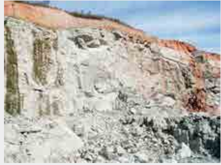
Quebras mecânicas em maciços