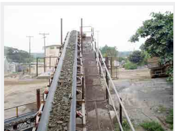
Partes móveis (roletes de correia transportadora) sem proteção