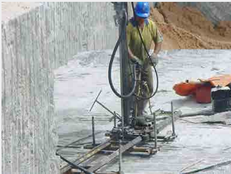
Equipamento corta-bloco com umidificação