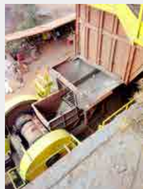
Partes móveis de britadores com proteção adequada